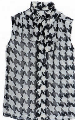
Top sans manches, imprimé pied-de-coq, et col lavallière, Sinequanone, 60 €, 01-42-77-80-80.