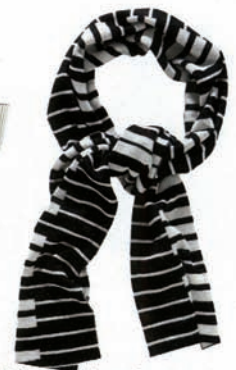
Echarpe en laine rayée, Gant, 105 €, www.gant.com