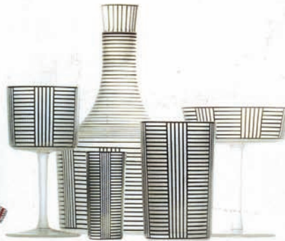
Ensemble de verres et carafe en cristal soufflé, Design Joseph Hoffmann, Compagnie Française de l'Orient et de la Chine, à partir de 170 €, 01-53-53-40-80.