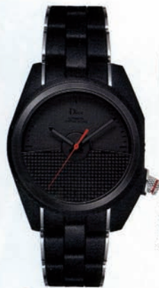
Montre chronographe Chiffre Rouge Mo5, automatique, Dior, prix sur demande, www.dior.com