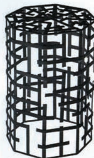
Tabouret en métal noir, Paola Navone pour Monoprix, 54 €, www.monoprix.fr