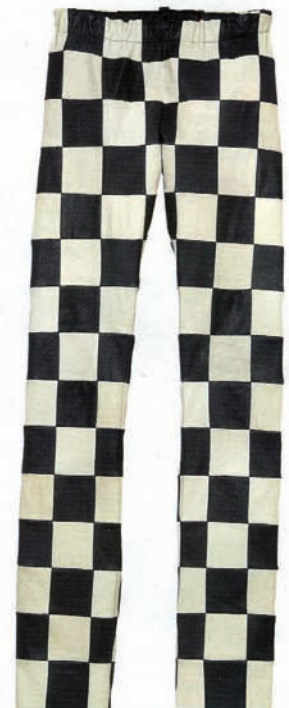
Pantalon en cuir damier, Stouls, 1 800 €, www.stouls.net