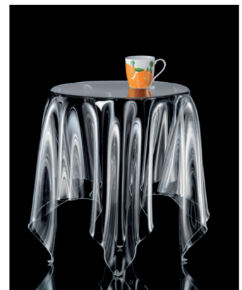
© LA BOUTIQUE D'ANNOISE Table Illusion Designer: John Brauer