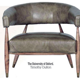
The University of Oxford, Timothy Oulton