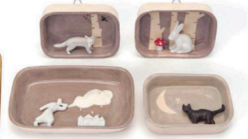
Ateliers d'art de France, design Elise Lefebvre