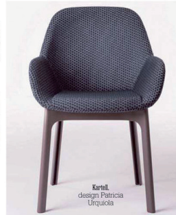
Kartell, design Patricia Urquiola