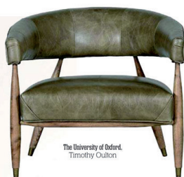
The University of Oxford, Timothy Oulton