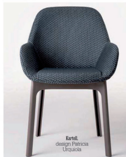
Kartell, design Patricia Urquiola