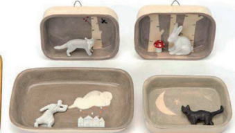
Ateliers d'art de France, design Elise Lefebvre